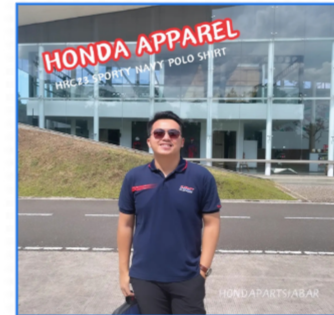
Amazing Race HGA T-Shirt

*boleh menggunakan HGA T-shirt model apa saja